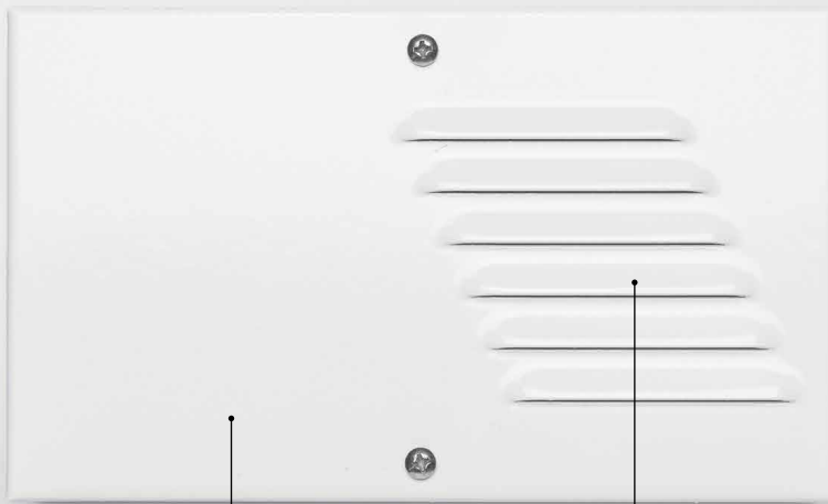
Coperchio esterno in metallo verniciato External cover in painted metal